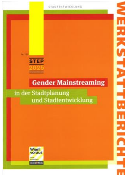
Gender & Diversity Rahmenplan III