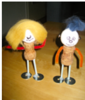
Abbildung 3: „Subjekte“

Vielfalt und Originalität auf. Aber bei aller Einmaligkeit jedes der entstandenen Produkte lassen sie sich alle dahin gehend zuordnen, ob sie „Subjekte“ im Sinne lebender Wesen symbolisieren wie Menschen oder Tiere (operationalisiert als „verfügt über Augen“) oder „Objekte“ wie Autos, Bauwerke oder Flugzeuge („verfügt nicht über Augen“).